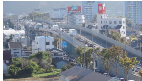
渋滞する国道170号(大阪外環状線)

大阪南部を縦断する幹線道路の国道170号(大阪外環状線)や、それに接続する国道309号や国道371号は従前より慢性的な渋滞を引き起こし、府道や市道の生活道路に交通が流れ込んでいる状況である。