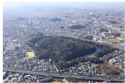
世界遺産「百舌鳥・古市古墳群」

大阪南部を含む周辺には、世界遺産の「 も 舌 ず 鳥・ ふるいち 古市古墳群」や、日本遺産の「中世に出逢えるま ふじいでら ち」、「 たけのうち 葛井寺」、「竹内街道」に加え「 にょにんこうや 女人高野」、「 かつらぎしゅげん 葛城修験」が新たに認定されるなど、歴史や文化などの地域資源が広域に存在し、その数は極めて豊富である。