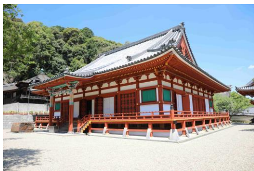
日本遺産「女人高野」天野山金剛寺

また、2025年には大阪万博も開催され、それを機に多くの観光客の来阪が予想される中、それぞれを周遊化し広域的に来訪者を呼び込む施策を図っていきたい。