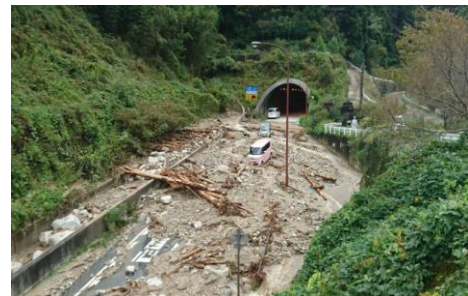
大雨により被災した国道309号

近年、多発している集中豪雨や台風の猛烈な風と大雨により、大阪南部においても幹線道路や生活道路に多大なる被害をもたらし、住民らは不自由な生活を強い